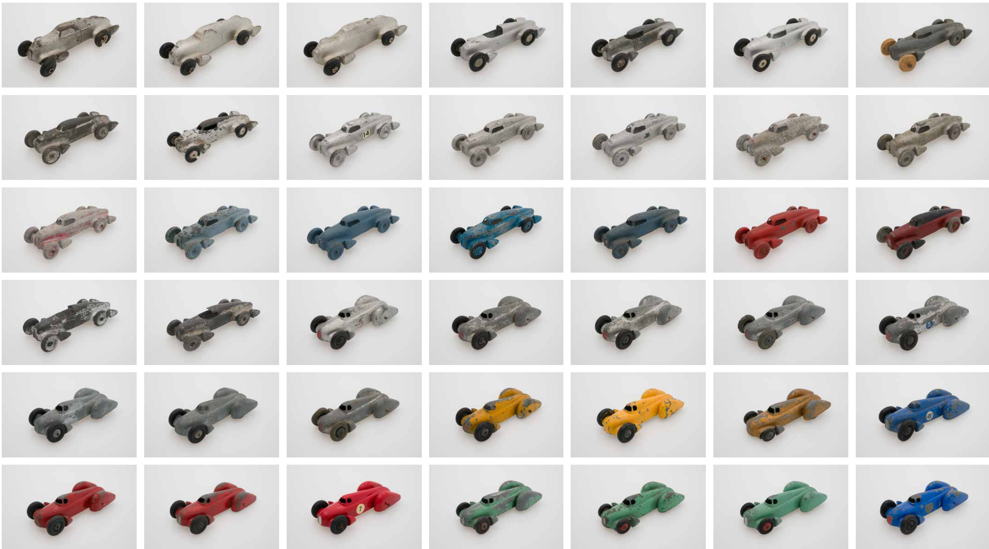
№ 035 1, G, SCHILDKRÖT (DE, ca. 1937) № 042 1, M, ELEKTRONMETALL CANNSTATT (DE 1936) № 083 1, A, KIBRI, KINDLER & BRIEL GMBH (DE 1939) № 088 1, A, KIBRI, KINDLER & BRIEL GMBH (DE 1939) № 061 1, Z, DINKY TOYS, 23D (GB ca. 1949) № 054 1, Z, DINKY TOYS, 23D (GB ca. 1949)