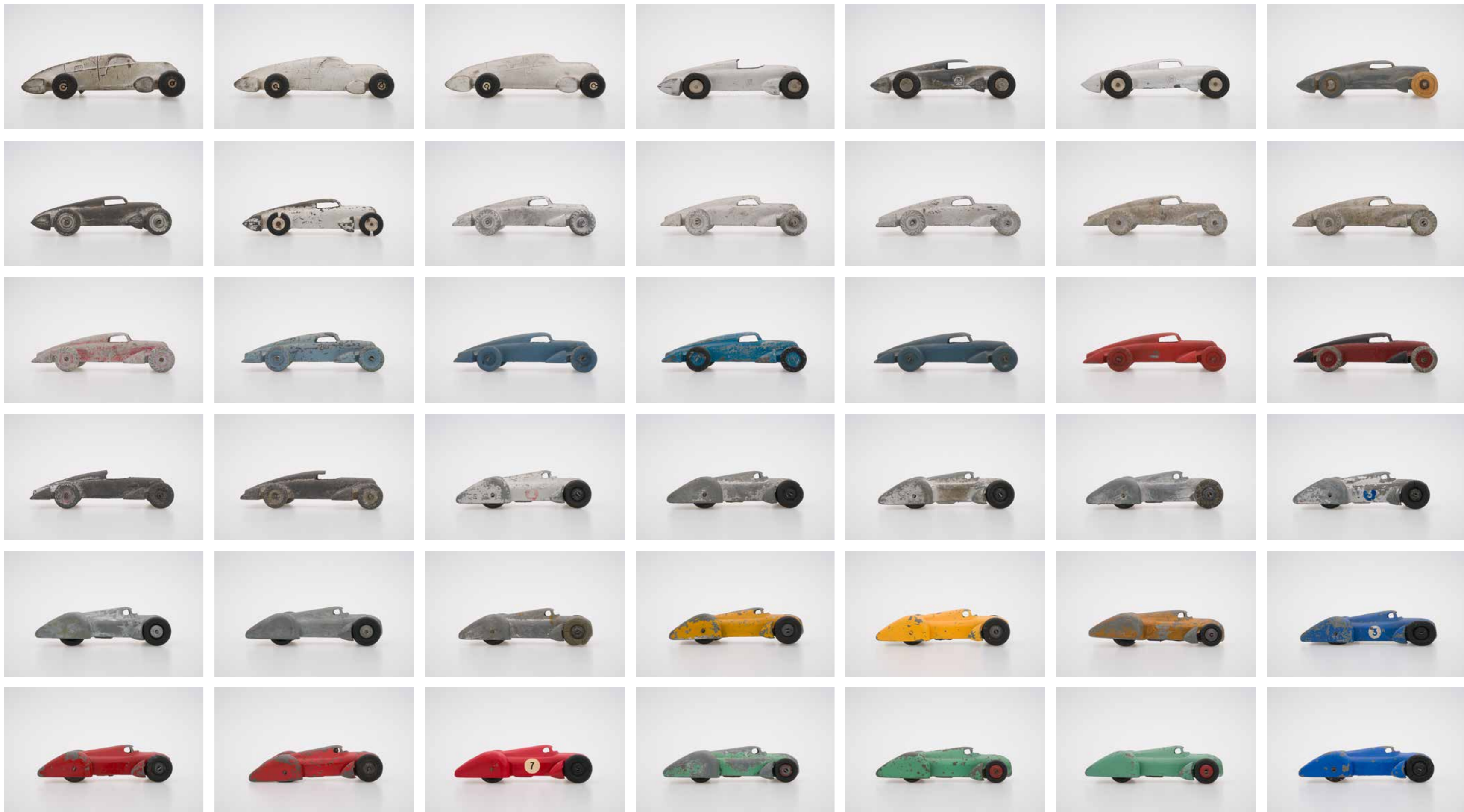
№ 035 1, G, SCHILDKRÖT (DE, ca. 1937) № 042 1, M, ELEKTRONMETALL CANNSTATT (DE 1936) № 083 1, A, KIBRI, KINDLER & BRIEL GMBH (DE 1939) № 088 1, A, KIBRI, KINDLER & BRIEL GMBH (DE 1939) № 061 1, Z, DINKY TOYS, 23D (GB ca. 1949) № 054 1, Z, DINKY TOYS, 23D (GB ca. 1949)